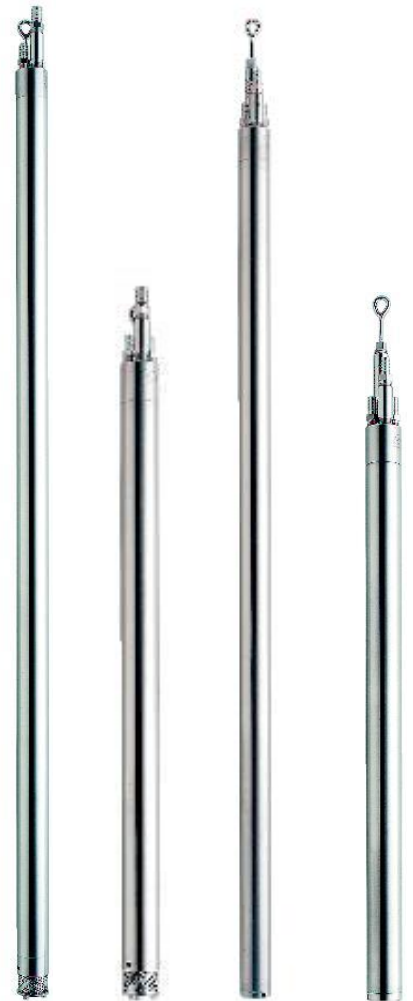
AP2BL AP2BS AP2TL AP2TS