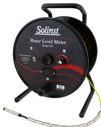
102 P10 (直径10mm)