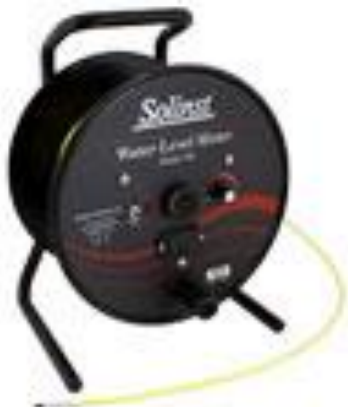
102 P4 (直径4mm)